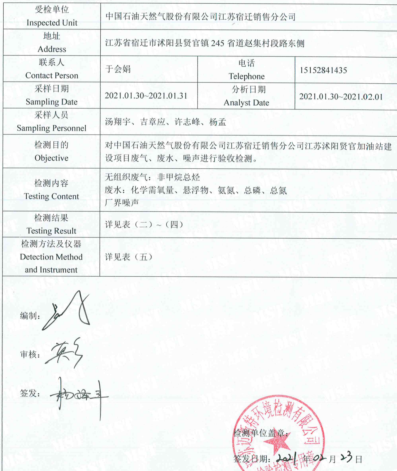
表 (一) 项目概况说明